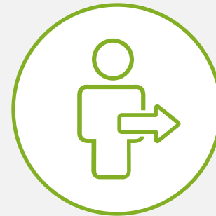
RECRUITMENT PROCESS OUTSOURCING