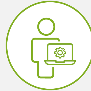
MANAGED SERVICE PROVIDER