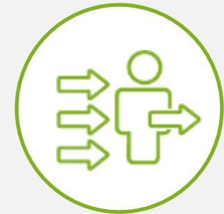
MASTER VENDOR MANAGEMENT